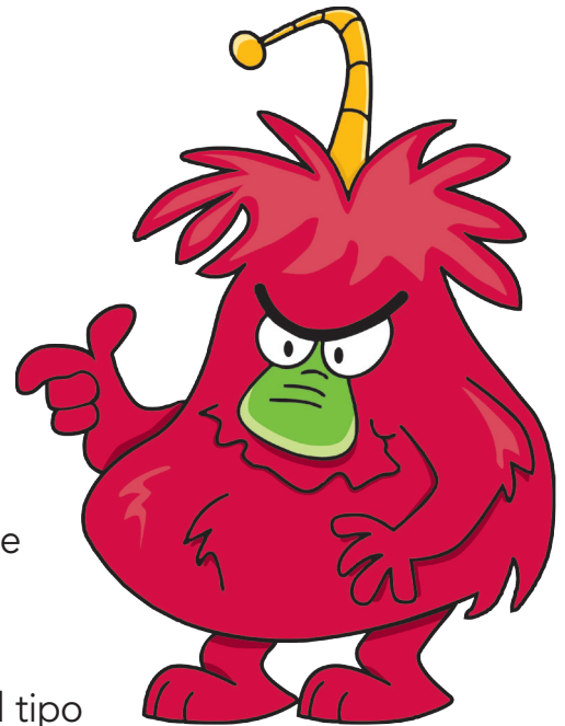
Comportamiento de Monstruos